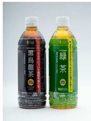
上図：(左) バイオマスマーク、(右) バイオマス PET ボトルを使用した当社商品