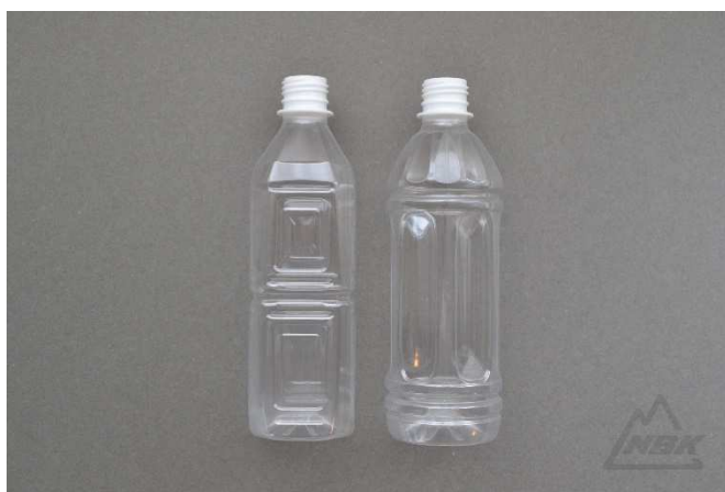
上図：バイオマス PET ボトル 500ml 角、500ml 多面（丸）